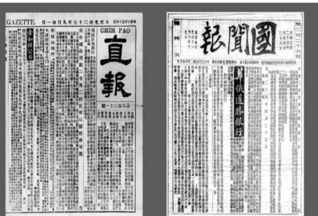
1895年1月，《直報》創刊於天津，它是德人出版的中文報。《論世變之亟》《原強》《辟韓》《救亡決論》均刊於此。

北大作為中國的最高學府之一，創辦之初曾經面臨停辦的危機，首任校長嚴復力挽狂瀾。這是怎麼回事呢？那就要從百年前開始說起。